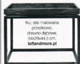
Nu, stal malowana proszkowo, drewno dębowe, 54x29x44,5 cm, loftandmore.pl