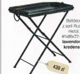
Beldeco z serii Rustic, metal, 41x66x72 cm, lawendowy-kredens.pl