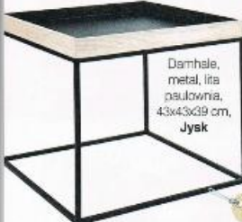
Damhale, metal, lita paulownia, 43x43x49 cm, Jysk